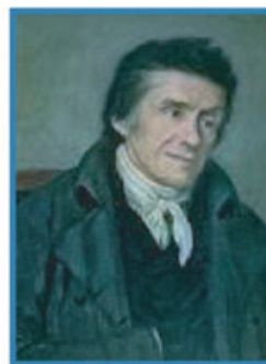
Johann Heinrich Pestalozzi

«Μεγάλος δάσκαλος δεν είναι αυτός που διδάσκει το καλό με ωραία λόγια, αλλά εκείνος που το διδάσκει με το παράδειγμά του.»