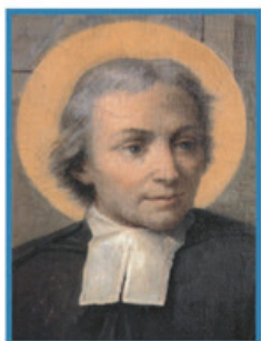
Saint Jean-Baptiste de La Salle

«Θέλετε οι μαθητές σας να κάνουν το καλό; Να το κάνουν πρώτα εσείς. Θα τους πείσετε πολύ περισσότερο από τα λόγια που θα τους πείτε με το προσωπικό σας παράδειγμα, όταν αυτό διαπνέεται από σύνεση και ταπεινοφροσύνη.»