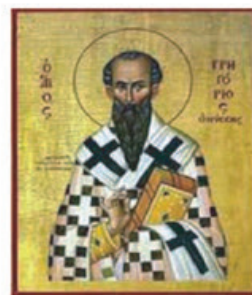
Άγιος Γρηγόριος ο Θεολόγος

Μη διακοψάτω σου μηδέ νυξ τον έλεον... Ο γαρ ελεών, φησίν, εν ιλαρότητι και διπλασιάζεται σοι το αγαθόν τη ετοιμότητι. Το γαρ λύπης, ή εξ ανάγκης, άχαρί τε και ακαλλώπιστον. Πανηγυριστέον δε, ου θρηνητέον την ευποιάν.