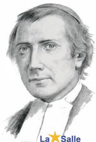
Saint Frère Salomon Leclercq (1745-1792)