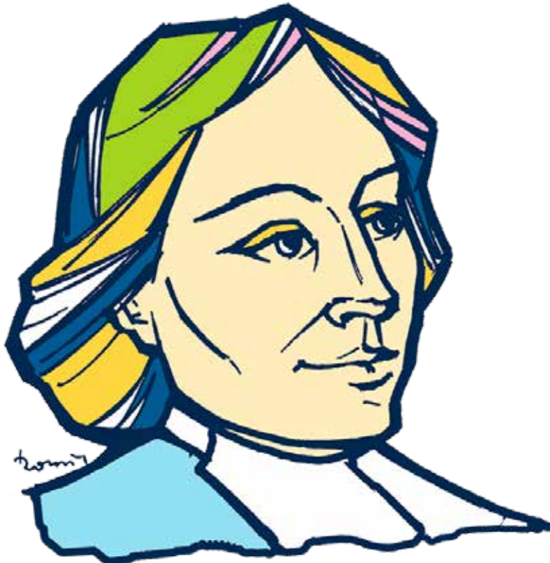
I.-B. ΔΕΛΑΣΑΛ (1651 – 1719)

«Θα πρέπει ο μαθητής να συνηθίζει να εργάζεται με επιμέλεια και ευσυνείδησία, όχι από φόβο ή εξαναγκασμό, αλλά από προσήλωση στο καθήκον.»